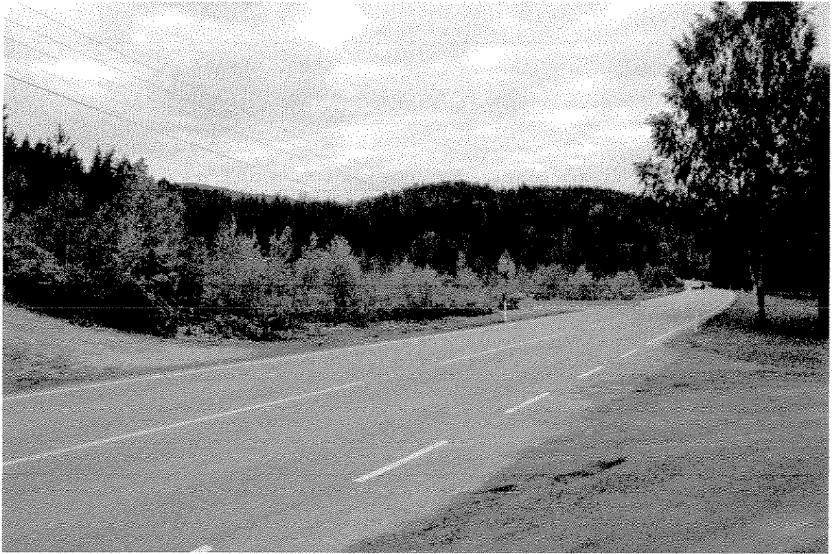
Grustaket sett sørfra. Rød pil markerer av/påkjøring