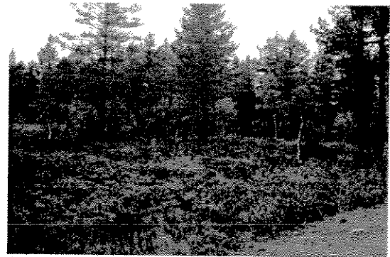
Vest for skogsbilvegen

Området er grunnlendt med noe fjell i dagen.