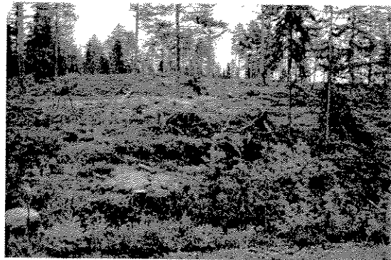
Fra skogsbilvegen østover mot kollen

Området som er aktuelt for utbygging er lokalisert på begge sider av skogsbilvegen sørover fra vannet. Hoveddelen av arealet utgjøres av en slak kulle øst for vegen. Solforholdene i området er svært gode. Deler av området er nylig uthogget, og vegetasjonen idag utgjøres av lyng og frøtrær. I området vest for skogsbilvegen er det enkelte mindre myrdrag – og blandingsskog.