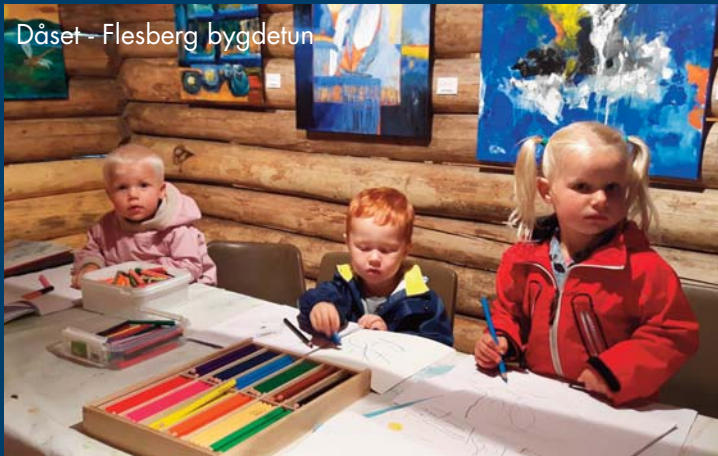
Dåset - Flesberg bygdetun