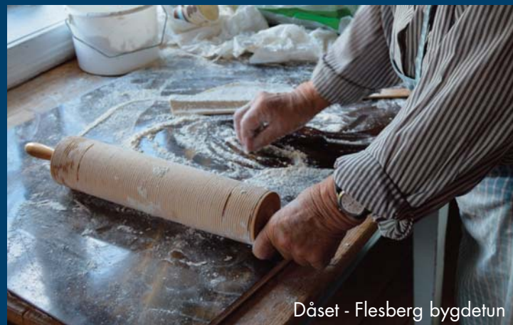
Dåset - Flesberg bygdetun