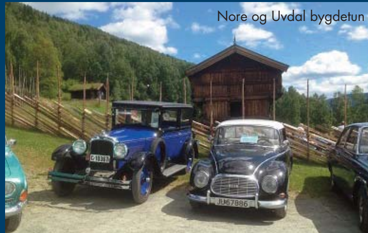
Nore og Uvdal bygdetun